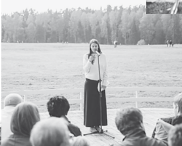
Молодая поэтесса Вера ПОЛОЗКОВА на фестивале будет отвечать за поэзию.

и сейчас, готовясь к этой презентации, перечитала и поняла, что мы всё правильно делаем, и наконец-то этому человеку, которому при жизни не достало признания, начинают возвращать долг.