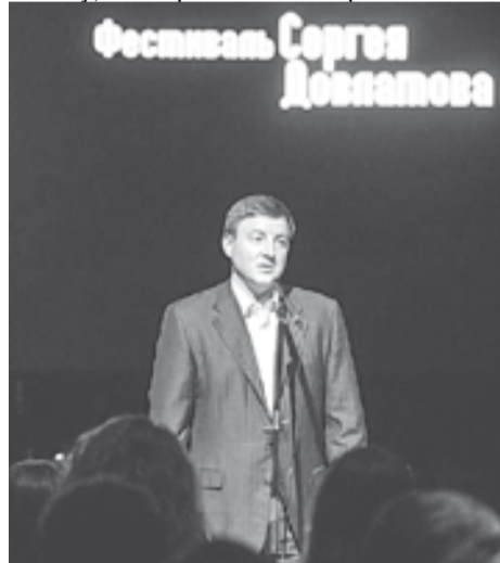
Губернатор Псковской области Андрей ТУРЧАК рассказал, как зародилась идея создания на псковской земле нового праздника.

Для поэтессы Веры Полозковой Сергей Довлатов не только кумир читательской юности, но и камертон неких жизненных и этических принципов, которые важны не меньше искусства: «Все прекрасно знают, что у Довлатова были очень специальные отношения — и с поэтами, и с поэтическим словом. И вообще, с этим пластом словесной культуры. И когда мне предложили курировать поэтическую часть фестиваля имени Довлатова, отказаться было невозможно! — рассказала о своём участии в проекте поэтесса. — Я думаю, это будут поэтические чтения невероятных талантливых и дорогих моему сердцу поэтов. Из очень разных мест. Из Одессы, Казани, Нью-Йорка. Толком они даже друг с другом не знакомы. Но при