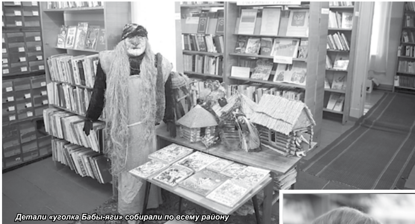
Детали «уголка Бабы-яги» собирали по всему району

В районной библиотеке благодаря творческим и неравнодушным людям возник центр притяжения малышни – резиденция сказочного персонажа