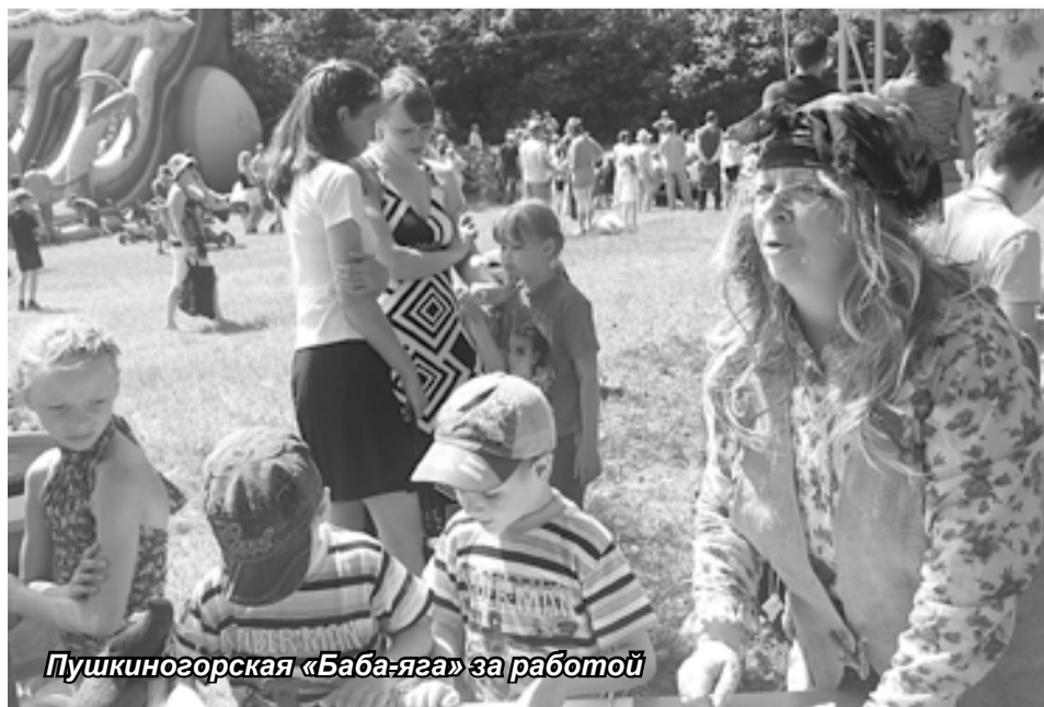
Пушкингорская «Баба-яга» за работой