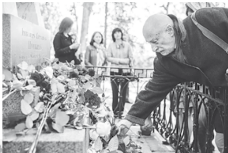
Известный детский писатель Григорий ОСТЕР примет активное участие в работе фестиваля. Будучи в Пушкиногорском районе, он не мог не возложить цветы к могиле Пушкина.

этом у них есть то, что Довлатов утверждал в своей прозе – невероятная любовь и снисходительность к человеческим слабостям, полное отсутствие дидактики и морализаторства. Я, как и все, в 14 лет влюбилась в Довлатова, и пока всего не прочла, не успоко-