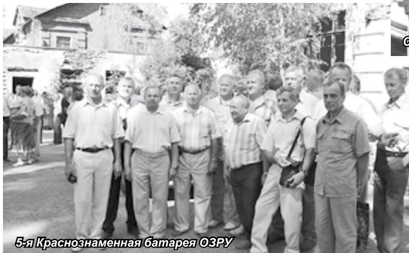
5-я Краснознаменная батарея ОЗРУ

Организаторы встречи юбилейные мероприятия решили начать именно с этого места. И пусть плац зарос кустарником и молодыми деревьями, пусть полуразрушенное здание казармы сморит на него пустыми глазницами окон, для офицеров ПВО (не зря ведь го-