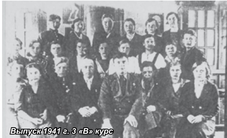
Выпуск 1941 г. 3 «В» курс