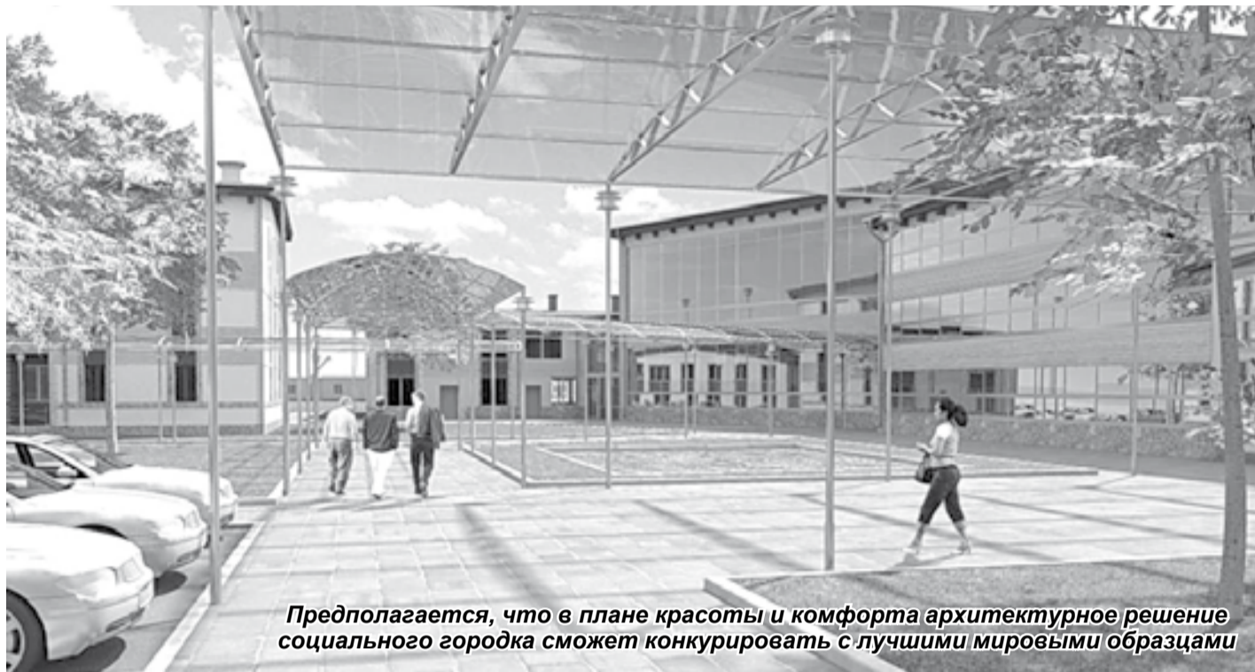
Предполагается, что в плане красоты и комфорта архитектурное решение социального городка сможет конкурировать с лучшими мировыми образцами

В Псковской области пожилым людям не только почёт и уважение