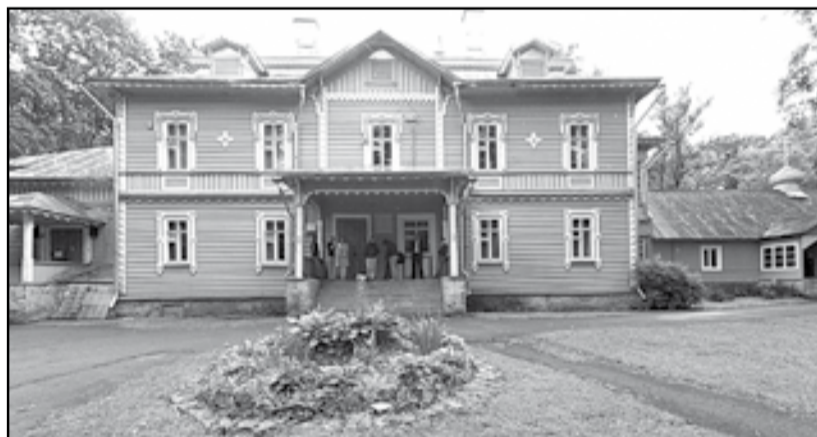
В здании старинной усадьбы в деревне Родовое Палкинского района общественники из Петербурга три года назад открыли реабилитационный центр для наркозависимых «Ручей»

- «Ручей» – это некоммерческая организация из Санкт-Петербурга. В 2011 году она открыла в деревне Родовое Палкинского района свой филиал – реабилитационный центр для наркозависимых. Всего у нас в регионе пять подобных реабилитационных центров. Но «Ручей» стал первым и пока единственным, который прошёл добровольную сертификацию на соответствие оказываемых услуг существующим стандартам. В стадии получения такого же сертификата сейчас находится Пушкиногорский реабилитационный центр Благотворительного фонда «Диакония». Так что в скором времени псковские наркозависимые, возможно, будут проходить реабилитацию не только в Палкинском районе.