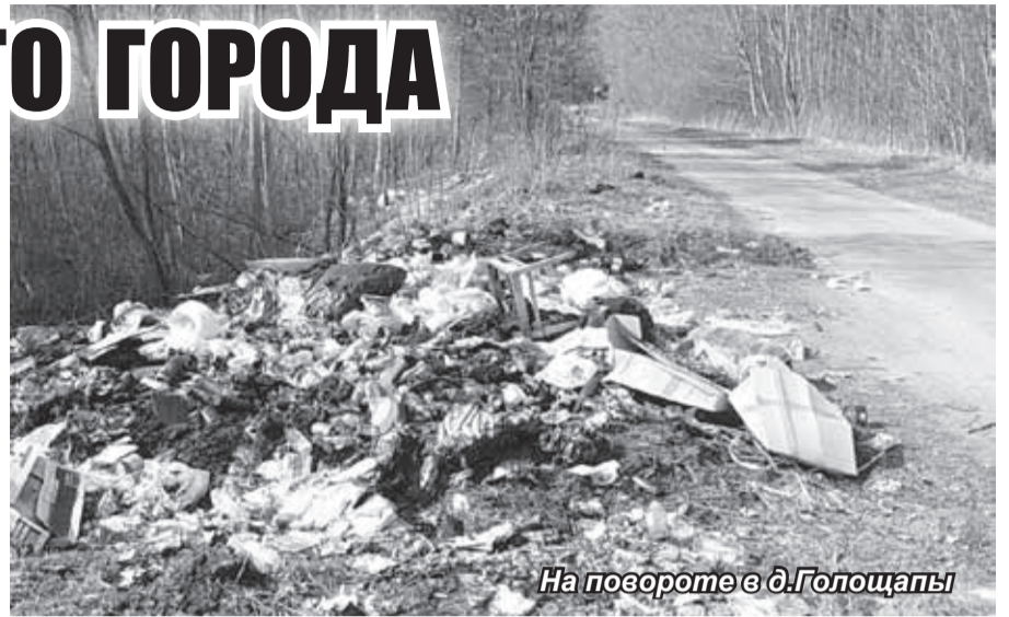
На повороте в д. Голощапы

Возле дома №8 вновь увидели кучу хлама: старые доски, двери и другое. По словам хозяина, все это является стройматериалом. Что он собирается строить – непонятно, но опасность возгорания создается этому дому реальная. Возле соседнего дома, пострадав-