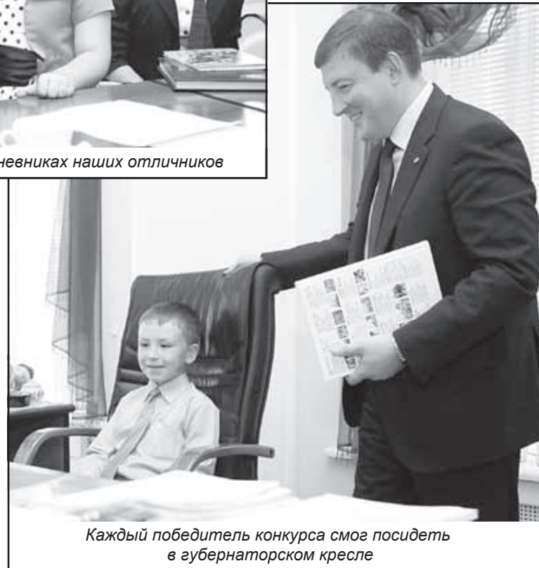
Каждый победитель конкурса смог посидеть в губернаторском кресле

«Учатся тоже по-разному, — рассказал врио губернатора. — У меня в этом году старший сын сдает ЕГЭ, как и все 11-классники. Следующая по возрасту дочка заканчивает 9 класс. Помладше дочка 5-й класс закончила, перешла