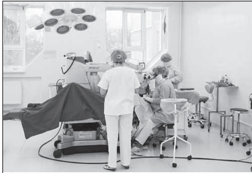
Сфера здравоохранения региона за последние пять лет значительно усилилась за счет вложений в оборудование и кадры

Временно исполняющий обязанности главы региона отчитался перед депутатами и жителями области о работе за пятилетку