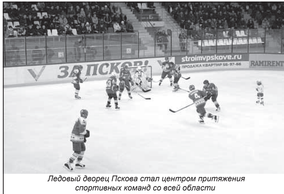
Ледовый дворец Пскова стал центром притяжения спортивных команд со всей области

В Печорах, Пушкинских Горах, Идрице, Кунье, Невеле, Палкине, Великолукском и Псковском районах, в Опочке, Гдове построены универсальные спортивные площадки или восстановлены стадионы.