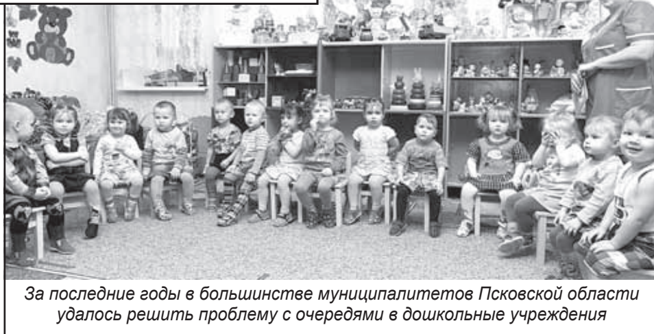
За последние годы в большинстве муниципалитетов Псковской области удалось решить проблему с очередями в дошкольные учреждения

Увеличился туристический поток в Изборске: за весь 2009 год Изборский музей зафиксировал 100 тысяч посетителей, а