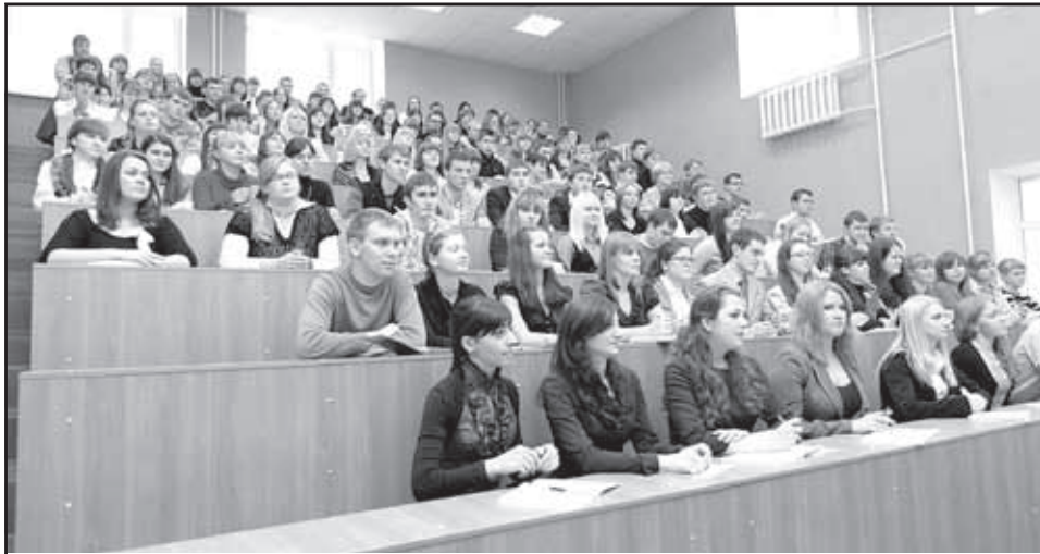
Студенты Псковского госуниверситета сегодня – главная надежда нашей области

Сегодня в университете обучается 10 тысяч студентов, открыт филиал инженерного профиля в Великих Луках, за два года открыты 33 новых образовательных программы, в том числе первая программа медицинского профиля. На 60% увеличилось количество бюджетных мест.