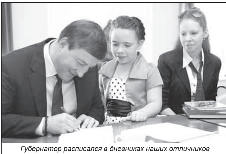
Губернатор расписался в дневниках наших отличников

«Учиться. Держать ушки на макушке», — ответили ребята.