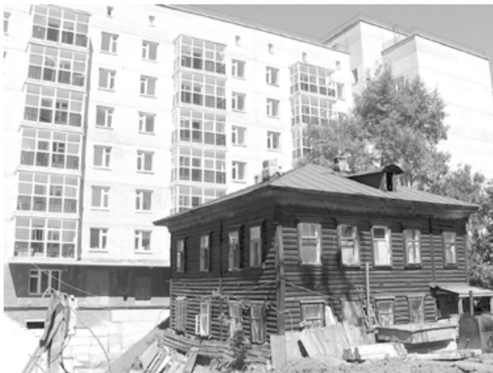
Ветхого жилья в регионе не мало, но работа по его расселению ведется методично и последовательно

- Он берет отсчет с 2013 года. После того, как президент подписал указ о повышении качества коммунальных услуг и улучшения жилищных условий граждан, акцент сделали на переселении граждан из аварийного жилья. По-