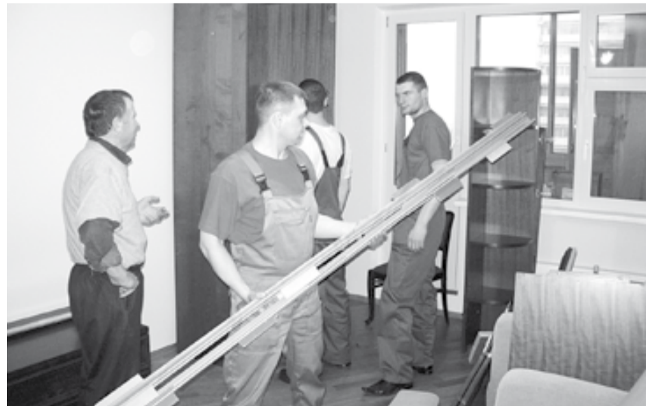
Новоселье – отличный праздник, жаль, что случается он в жизни большинства из нас не так часто

Более того – и на следующий год Псковская область первой из всех регионов Северо-Запада подала общую заявку на переселение (второй этап 2014