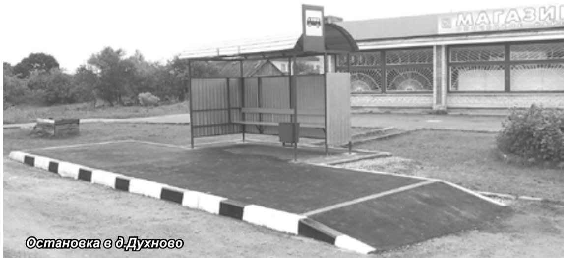
Остановка в д.Духново

В Опочке в рамках программы восстановления улично-дорожной сети и дворовых территорий выполнены работы на общую сумму более десяти миллионов рублей. В частности, заасфальтированы дворы двух домов на улице Кутузова и въезд на территорию районной больницы.