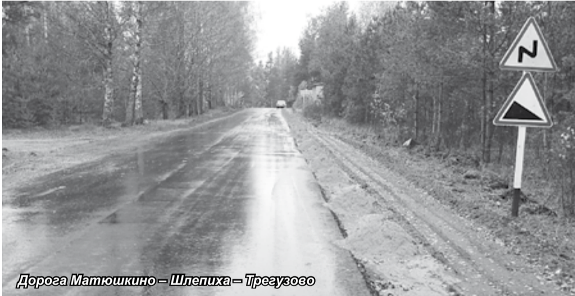
Дорога Матюшкино – Шлепиха – Трегузово

Нынче асфальтом покрыли также участки проезжей части улиц 1 Мая, Набережной, Романенко, Карла Маркса, подъезд к улице Автозаводской. Одиночная обработка дорожного покрытия проведена на улицах Калинина и Дзержинского, а также на мосту объездной дороги.