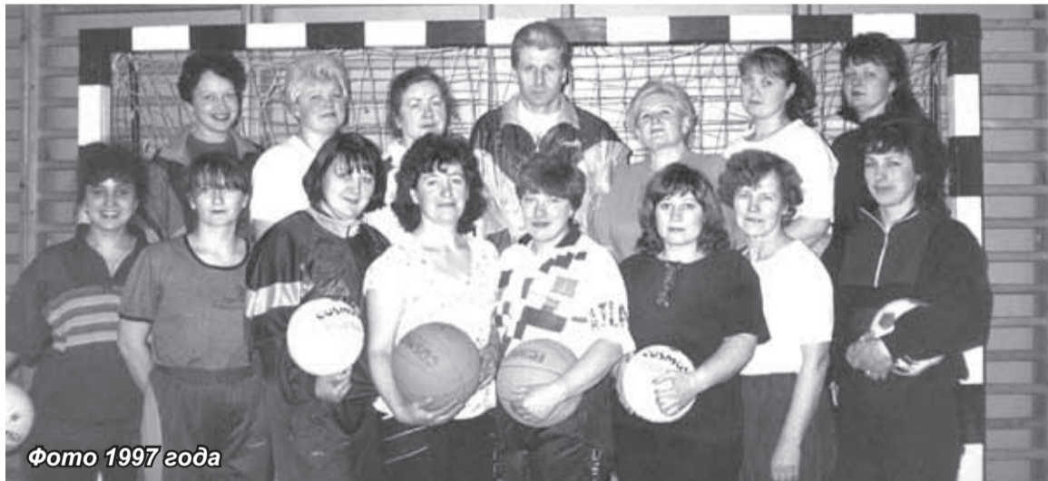
Фото 1997 года

В феврале 1983 года на базе школы №4 начались занятия в спортзале для женщин нашего города. Два раза в неделю на два часа женщины приходили в зал, чтобы посвятить их своему здоровью. Занятия включали в себя час разминки (нагрузка на все группы мышц) и спортивные игры – волейбол, баскетбол, народный мяч, настольный теннис и другие.