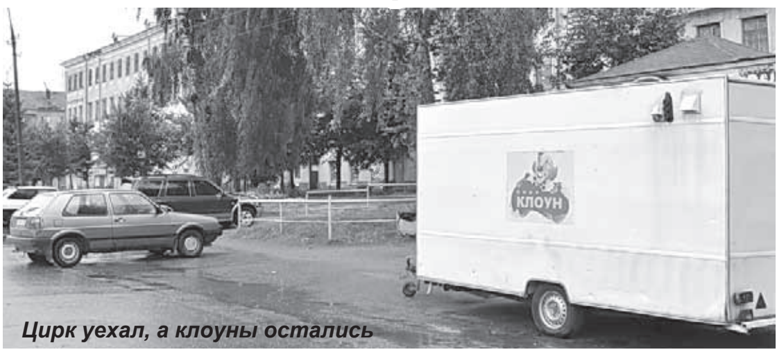
Цирк уехал, а клоуны остались