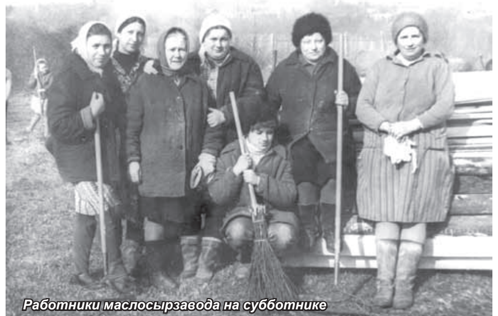
Работники маслосырзавода на субботнике

Объемы производства на Опочецком маслосырзаводе постепенно росли. В 1947 году на завод поступило 104518 гектолитров молока из совхоза «Красный фронтвик», 34055 гектолитров из совхоза «Федоровское» и 864 гектолитра из Поддубья соседнего Пустошкинского района. Молоко на завод также сдавали колхозные молочные фермы, сами колхозники, единоличники, городские рабочие и служащие. Всего в 1947 году Опочецкий маслосырзавод закупил около 1500 тонн молока. Развивалась и техническая оснащенность производства. В том же 1947 году на заводе использовались 2 сепаратора «Урал», 3 сепаратора «Звезда», еще 10 сепараторов разных конструкций и даже немецкий холодильник Шмидта.