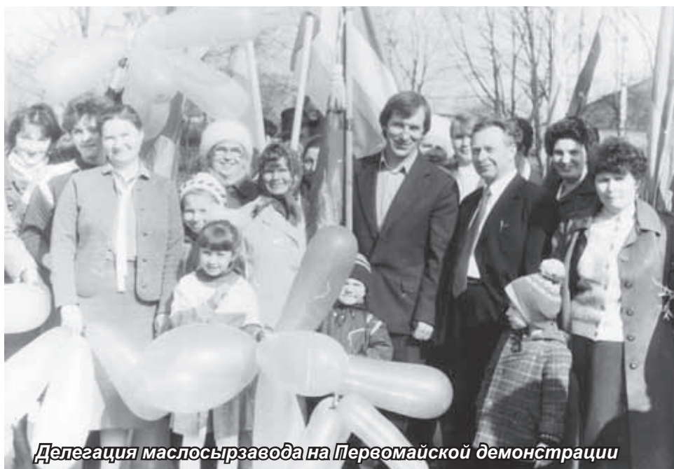
Делегация маслосырзавода на Первомайской демонстрации

что я «уже вырос из коротких штанишек» и с должности зама пора переходить на должность руководителя. Я попросил время на раздумье, хотя прекрасно понимал, что спорить с райкомом всегда было чревато.