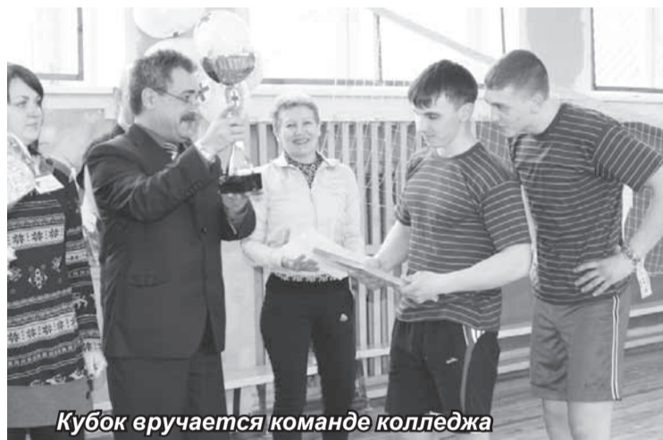
Кубок вручается команде колледжа

Судейская бригада подводила итоги в двух возрастных группах. В юношеской соперничали команда №2 Опочецкого индустриально-педагогического колледжа и ребята из Пыталова. Они не уступали друг другу в скорости и ловкости, и лишь в последней эстафете гости из Пыталова сумели выйти вперед.