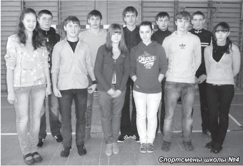
Спортсмены школы №4

На вопрос о том, есть ли в нашем районе условия для занятий спортом, ребята ответили, что все возможно,