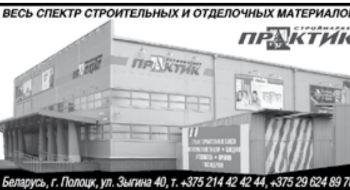
Беларусь, г. Полоцк, ул. Зыгина 40, т. +375 214 42 42 44, +375 29 624 89 78.

Кафе «Шашлычная» на «лысой горе» поздравляет всех с наступающими праздниками и приглашает жителей и гостей города на встречу Нового года в уютной обстановке в нашем кафе. Тел. 8-951-7578471.