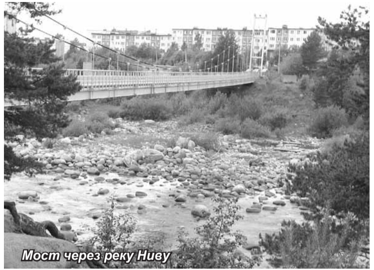
Мост через реку Ниву

По пути в Кандалакшу существенные изменения погоды начались в Карелии. Если дождик, пригнанный ветром с Ладоги, был по-настоящему летним, то чем дальше мы углублялись в Карелию, тем погода все больше напоминала осеннюю. Но это не могло испортить настроение и не мешало любоваться красо-