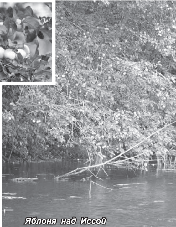
Яблоня над Иссой

Там, где Исса пересекает земли одноименного сельскохозяйственного кооператива, ее берега как будто подстрижены газонокосилкой. Зрелище ред-