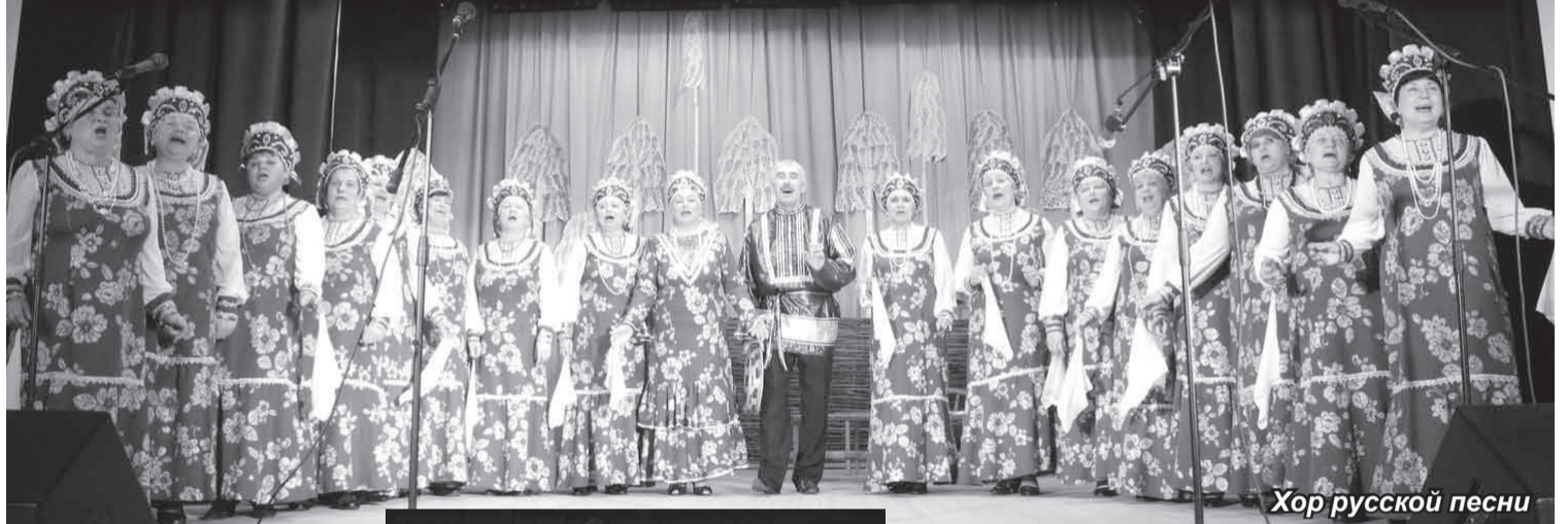
Хор русской песни

6 апреля народный самодеятельный коллектив «Хор русской песни» Опочецкого районного Центра культуры пригласил опочан и гостей города на большую праздничную программу «При народе в хороводе», посвященную 25-летию этого коллектива.