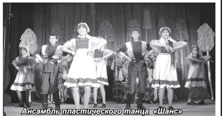
Ансамбль пластического танца «Шанс»