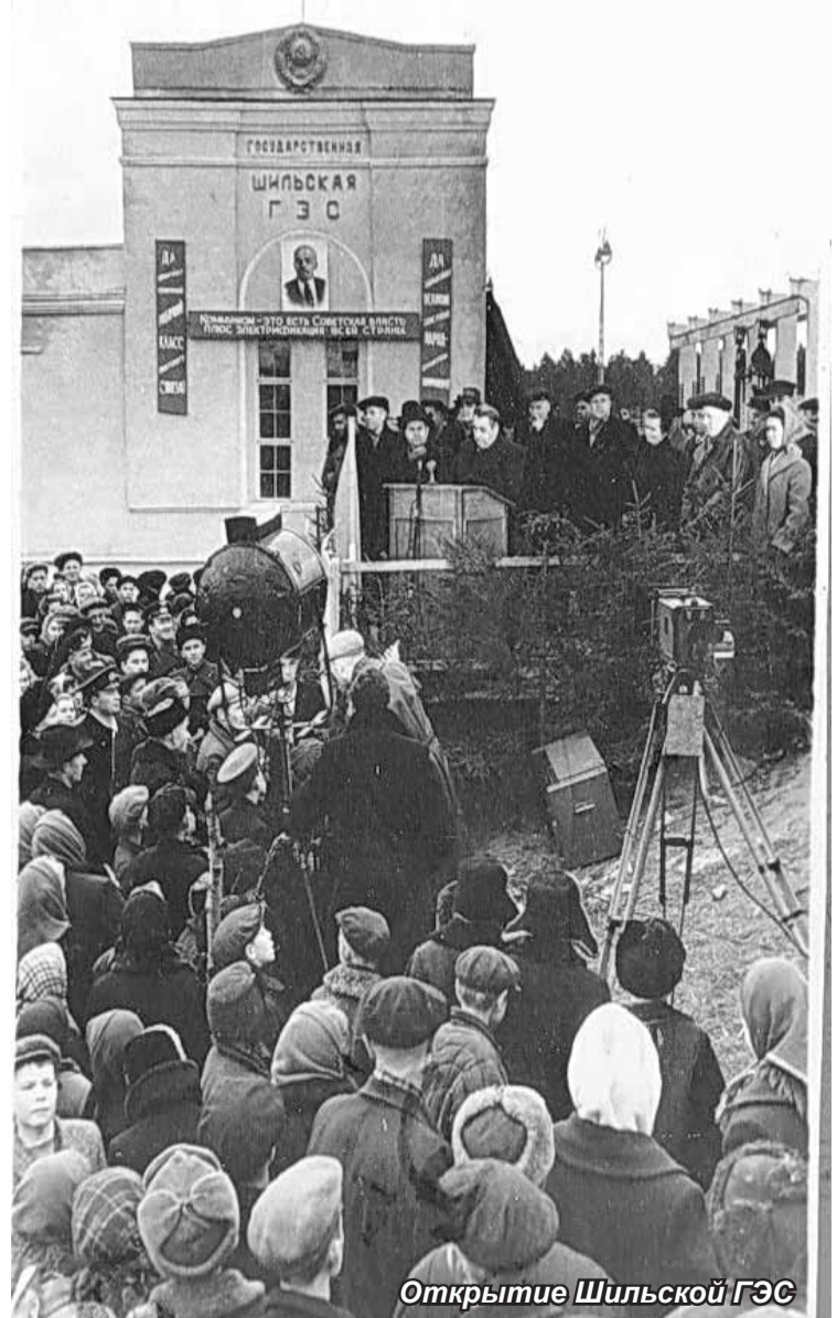
Открытие Шильской ГЭС