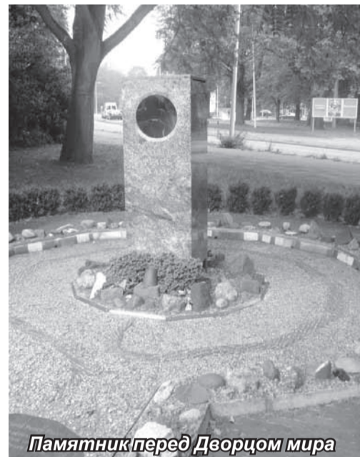
Памятник перед Дворцом мира

Всегда найдутся в группе люди, которые к поездкам готовятся основательно, поэтому