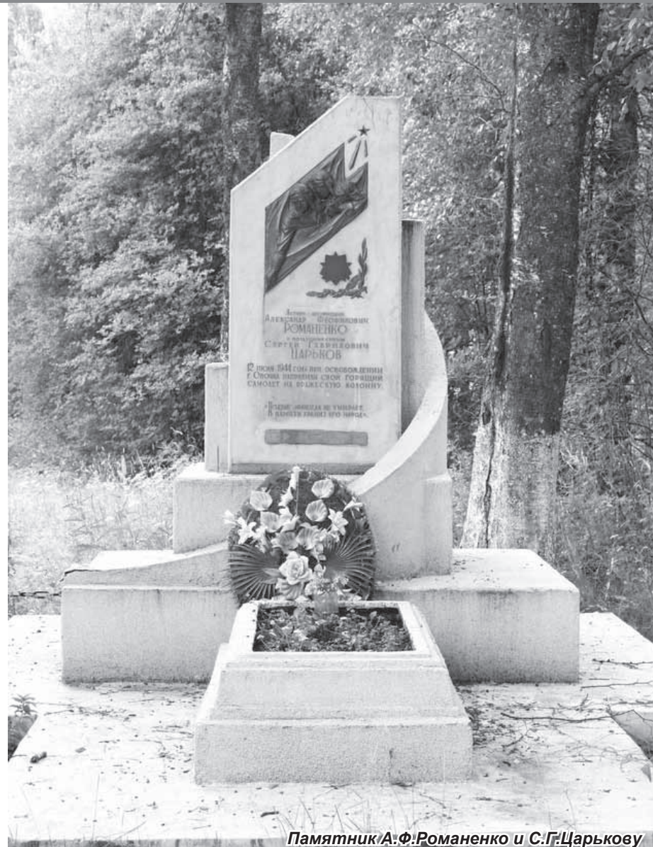
Памятник А.Ф.Романенко и С.Г.Царькову