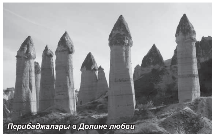
Перибаджалары в Долине любви

ческими лампами, по лестницам и переходам спускаются длинными вереницами десятки туристов, так что здесь совсем не страшно. Экскурсовод провел нас до церкви, находящейся почти в самом низу, на седьмом уровне. Это довольно просторное помещение, крестообразное в плане, длиной 25 метров, шириной 10, высотой 2,5.