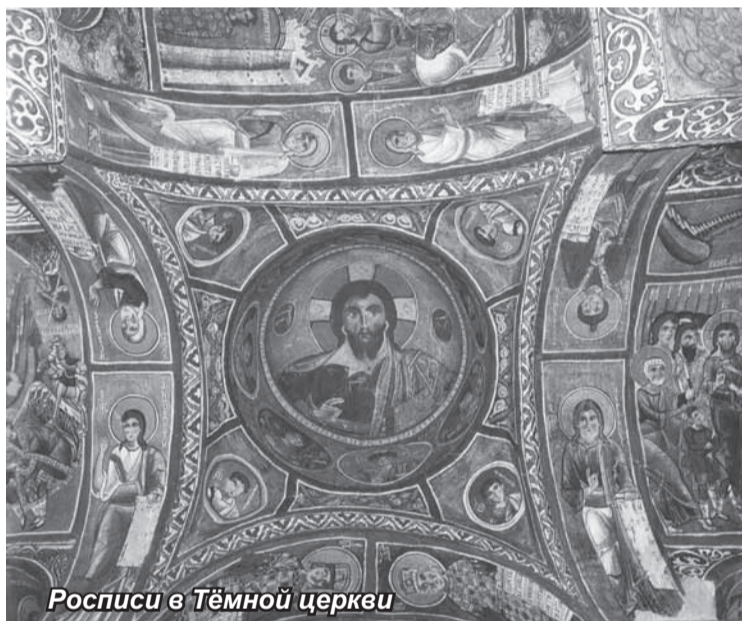
Росписи в Тёмной церкви

Поскольку город строился как убежище, в нем есть специальные средства обороны – круглые, в виде жерновов, каменные двери. Закрывать их можно было только изнутри. Интересно, что эти двери, как правило, изготавлива-