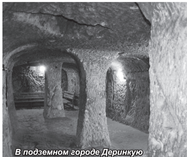
В подземном городе Деринкую