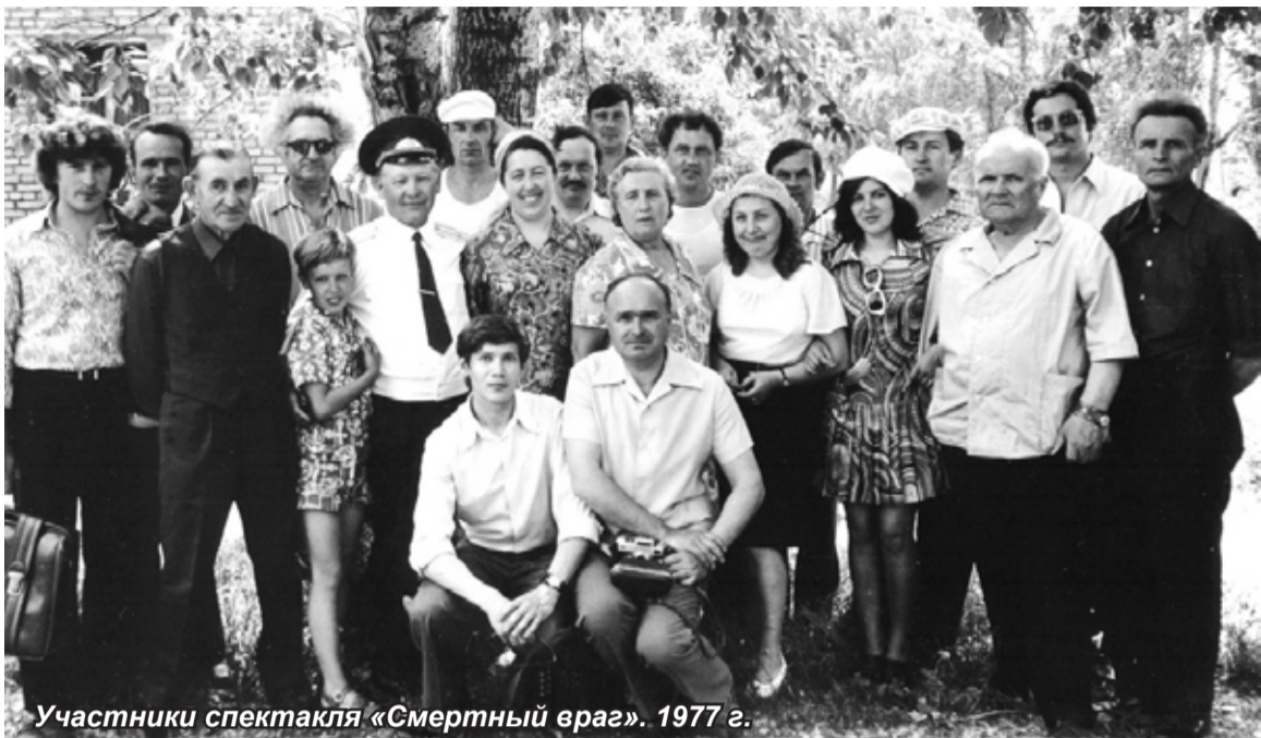
Участники спектакля «Смертный враг». 1977 г.

Готовились весь январь. Пришлось переделывать декорации