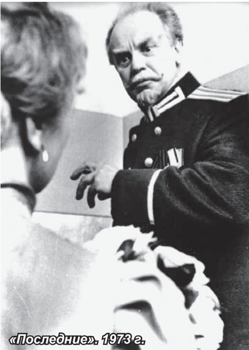
«Последние». 1973 г.