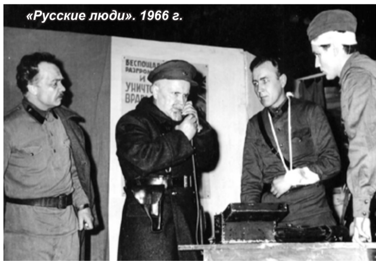
«Русские люди». 1966 г.