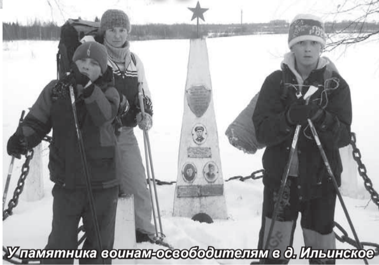
Упамятника воинам-освободителям в д. Ильинское