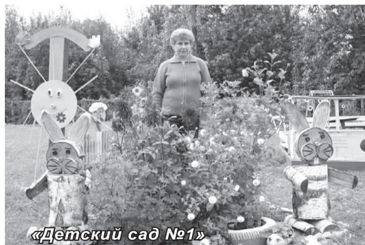
«Детский сад №1»