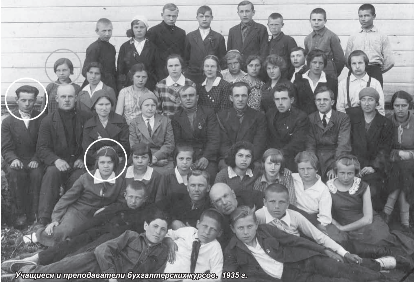
Учащиеся и преподаватели бухгалтерских курсов. 1935 г.

Уже бывало, когда публикация в «Красном маяке» старой фотографии вдруг вызвала неожиданные отклики – кто-то узнавал на ней своих родных и даже приносил в редакцию дубликат такого снимка из своего собственного семейного архива.