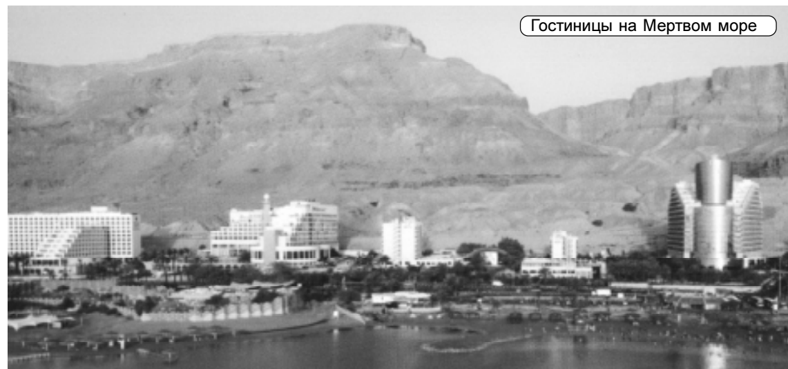
Гостиницы на Мертвом море

Да и не вода это вовсе, а насыщенный солевой раствор. Маленькая цапапина на теле сильно щиплет. Иду по пологому дну. Плечи еще высоко над водой, а ноги уже отрываются от дна, и я превращаюсь в поплавок. Пытаюсь лечь на спину, но меня переворачивает на бок. Тогда, как все, раскидываю руки. Теперь удается удержаться на спине. На щите информации – надпись: больше 15 минут находиться в воде (по сути, в рассоле) вредно. Следить за временем можно по большим часам на спасательной вышке, обращенным к воде. Увы, пора под пресный душ на берегу. Чуть позже жара становится невыносимой, и большинство купавшихся, приехавших с палатками с вечера, покидает пляж. Да и атмосферное давление у Мертвого моря повышенное.