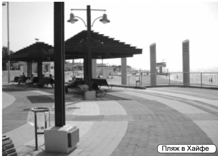
Пляж в Хайфе