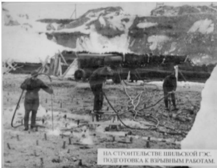
НА СТРОИТЕЛЬСТВЕ ШИЛЬСКОЙ ГЭС. ПОДГОТОВКА К ВЗРЫВНЫМ РАБОТАМ.

Один из стендов фотоэкспозиции, посвященной 65-летию Псковской области, – это небольшая фотоистория Шильской ГЭС. Всего несколько фотографий, но за ними огромный труд многих людей и целый пласт истории нашего района, а значит, и всей Псковской области.