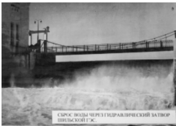
СРЯС ВОДЫ ЧЕРЕЗ ГИДРАВЛИЧЕСКИЙ ЗАТВОР ШИЛЬСКОЙ ГЭС.

Один из стендов фотоэкспозиции, посвященной 65-летию Псковской области, – это небольшая фотоистория Шильской ГЭС. Всего несколько фотографий, но за ними огромный труд многих людей и целый пласт истории нашего района, а значит, и всей Псковской области.