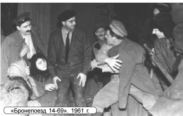
«Бронепоезд 14-69». 1961 г.