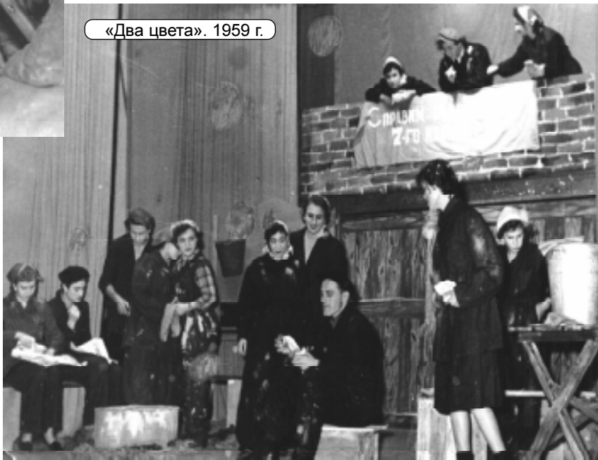
«Два цвета». 1959 г.

В 1965 году на смотре сельской художественной самодеятельности «Машенька» получила диплом I степени и претендовала на выступление в Москве, в Кремлевском театре, но