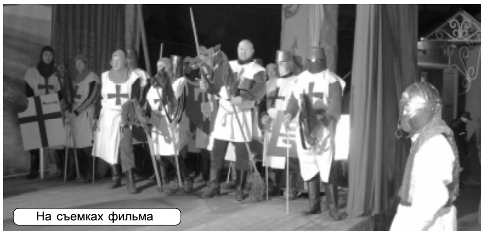
На съемках фильма