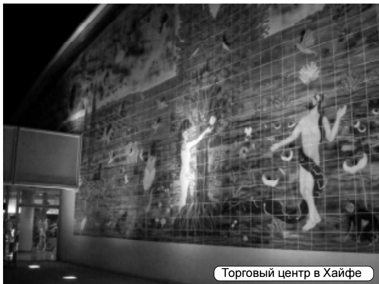
Торговый центр в Хайфе