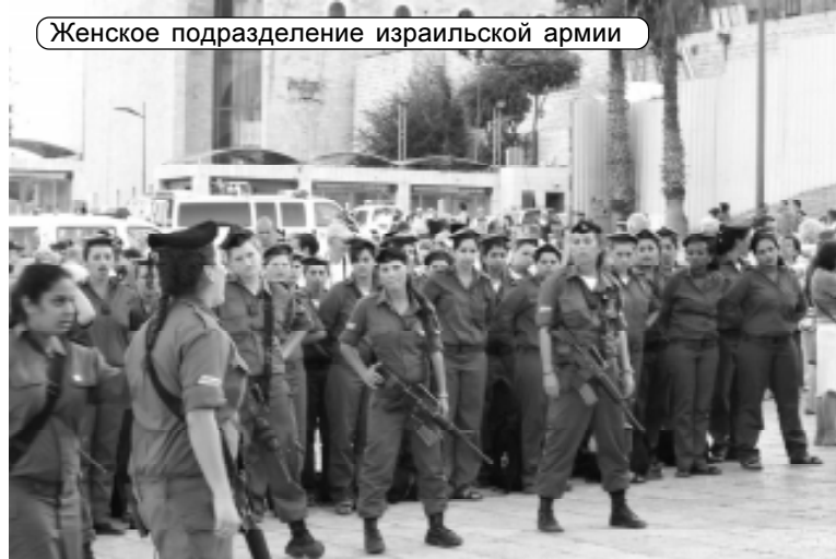
Женское подразделение израильской армии

На входе в большие магазины охрана проверяет металло-