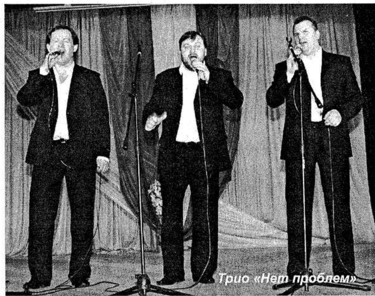
Трио «Нет проблем»