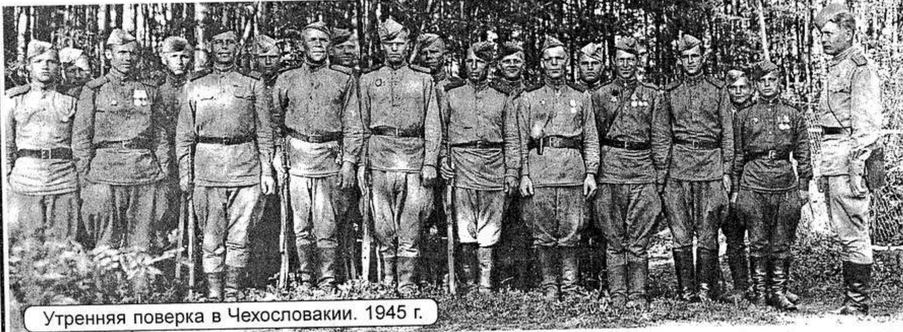
Утренняя поверка в Чехословакии. 1945 г.

цы шли строем, один за другим, что-то вроде психологической атаки. Рассказывал, как бесконечно перезаряжали ленты в пулемёте, а они всё шли и шли. Потом начинал плакать, и рассказ заканчивался.