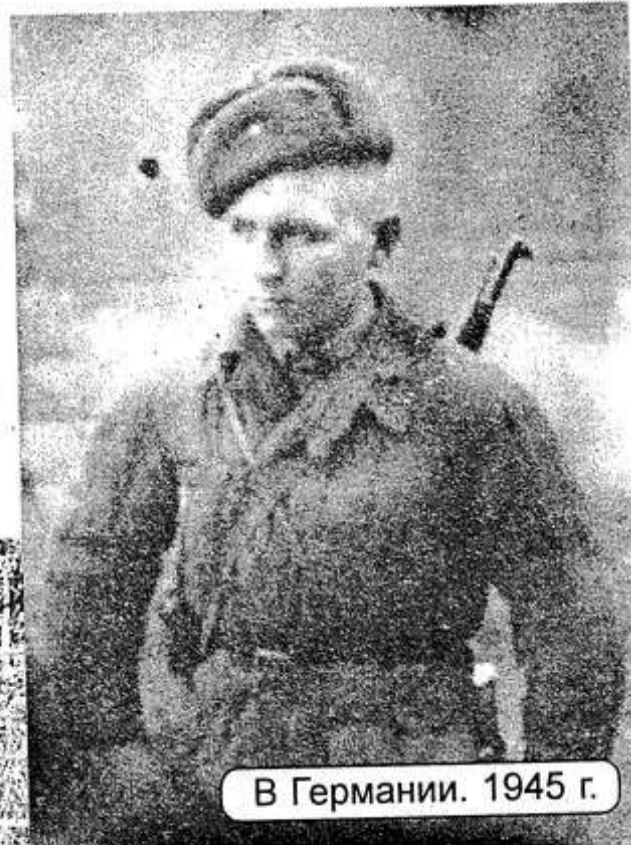
В Германии. 1945 г.