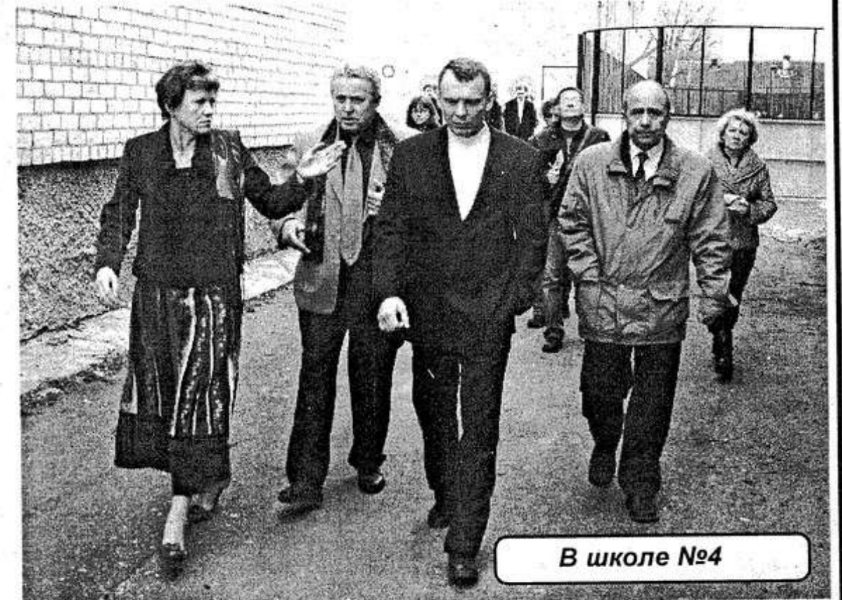
В школе №4