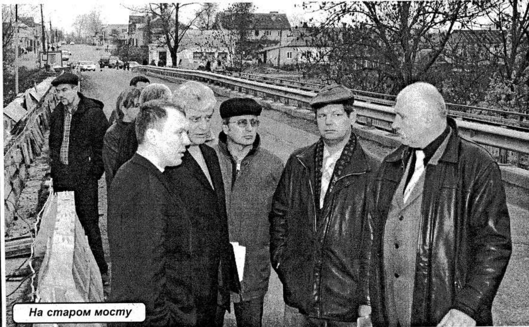
На старом мосту

22 октября в Опочке побывал губернатор Псковской области М.В. Кузнецов. Он посетил новый мост через Великую, связавший дороги Опочка – Пустошка и Опочка – Себеж (и далее на Белоруссию), Опочечскую центральную районную больницу, новую спортивную площадку в средней школе №4, гимназию.