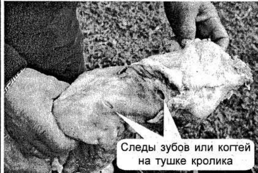
Следы зубов или когтей на тушке кролика