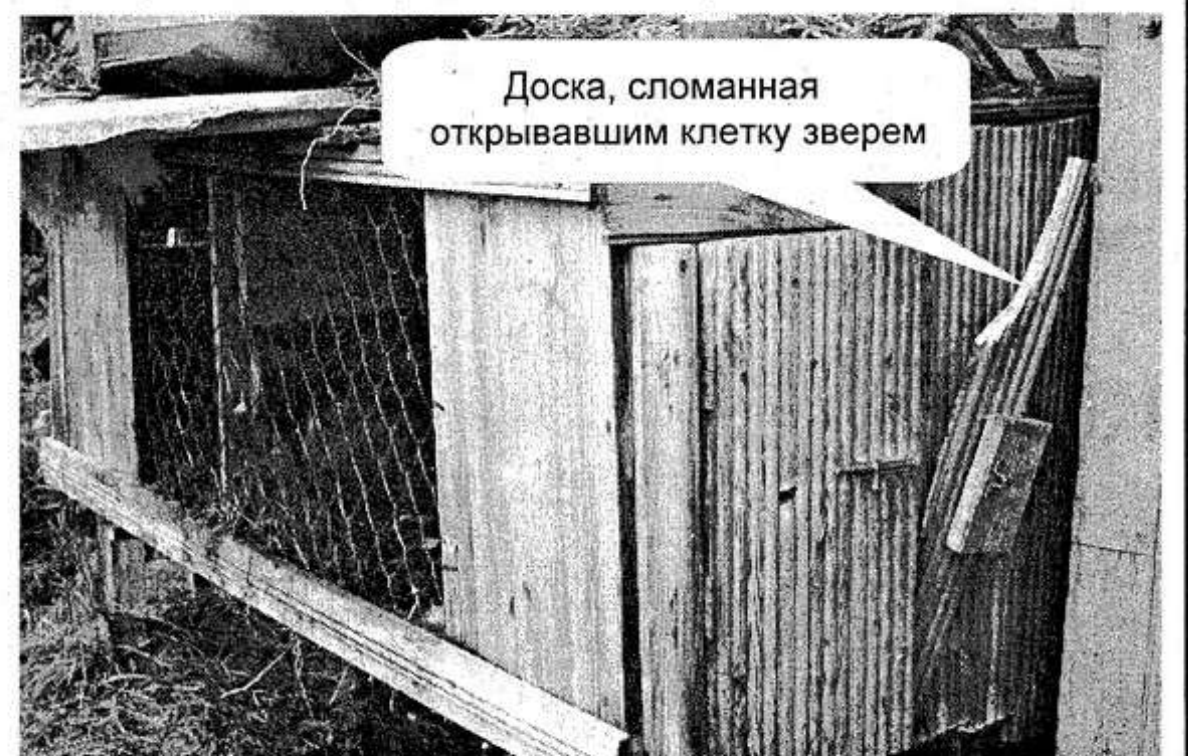
Доска, сломанная открывавшим клетку зверем