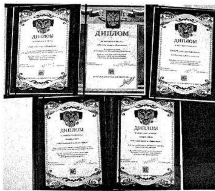
НА СНИМКЕ: дипломы конкурса «100 лучших товаров России»

При подведении итогов среди профильных предприятий продукция опочецких хлебопеков была отмечена пятью дипломами (это самое большое количество наград). Дважды в номинации «Новинка года» были отмечены вода питьевая фасованная «Опочанка» и вода минеральная питьевая столовая «Преображенская», дипломом лауреата отмечены безалкогольные напитки, дипломантами стали хлеба «Ржано-пшеничный российский», «Коложский», заварные хлеба «Ржаной обойный», «Московский ржаной».