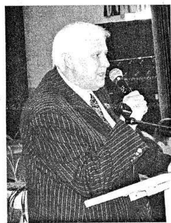
Незадолго до Дня пожилого человека представительная делегация побывала в Опочечком доме-интернате для пре-