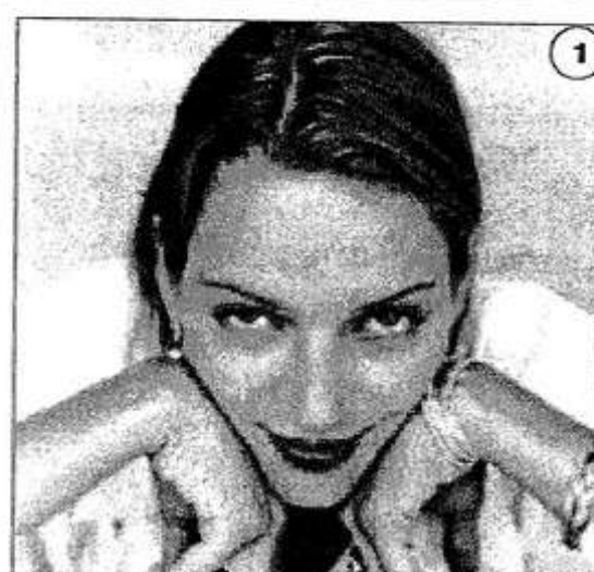
Ее отец, давший всем своим четверым детям индийские имена, стал первым американцем, постриженным в буддийские монахи. В сан его посвящал лично далай-лама