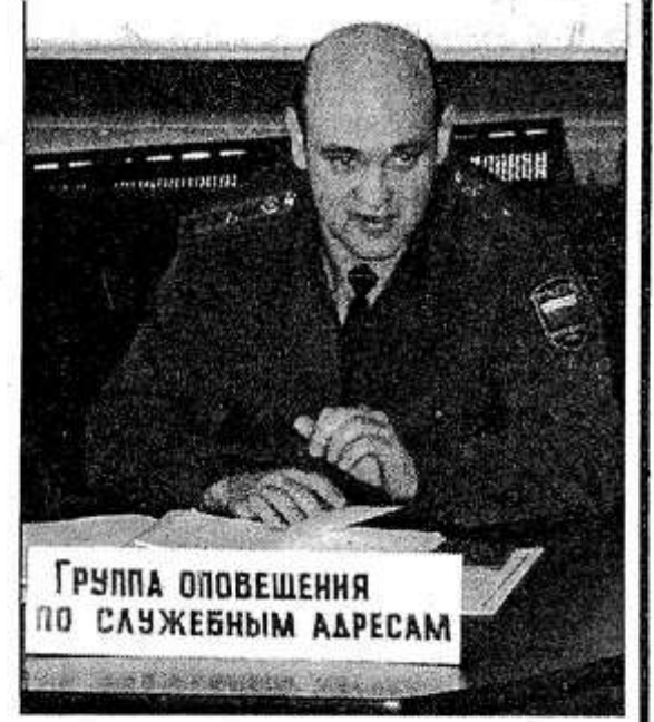
Группа оповещения по служебным адресам

Также законом предусмотрено, что за неоповещение граждан о вызове их по повестке, а равно необеспечение гражданам воз-