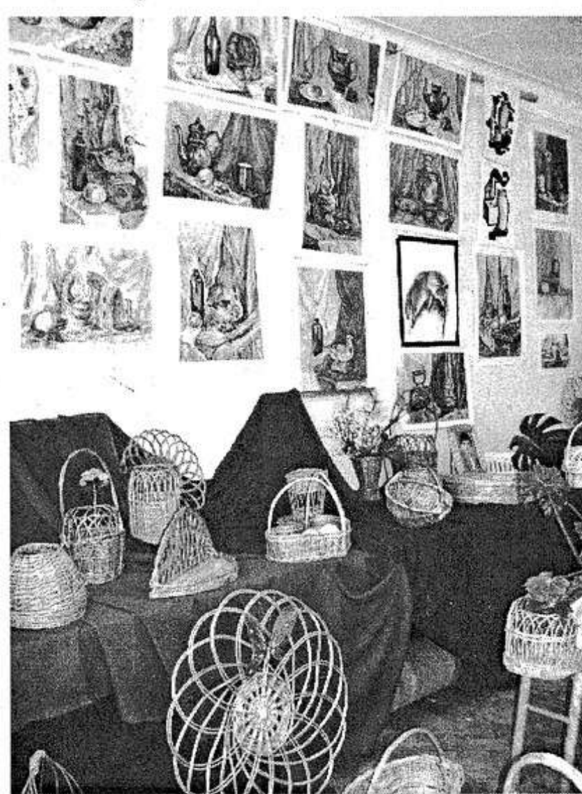
ные выставки стали в Опочке традиционными и проходили чаще.

Те, кто уже побывал на выставке, отзываются о ней с восхищением. Приятно отметить, что это уже вторая летом 2005 года. Хотелось бы, чтобы художествен-