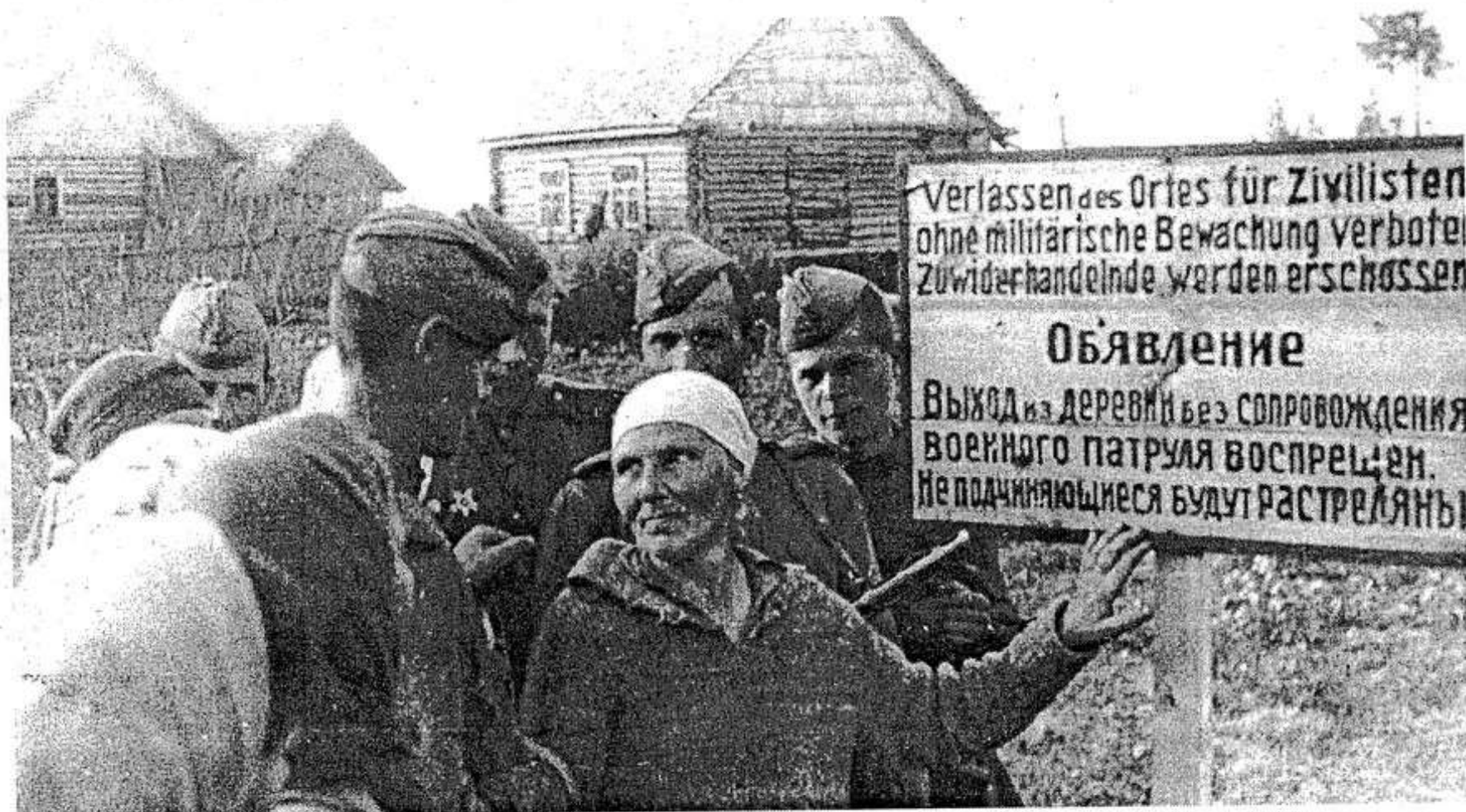
Жители села близ Опочки рассказывают своим освободителям, бойцам 2-го Прибалтийского фронта, о тяжелой жизни в немецкой неволе.

25 июня 1944 г. Место съемки: Псковская область.