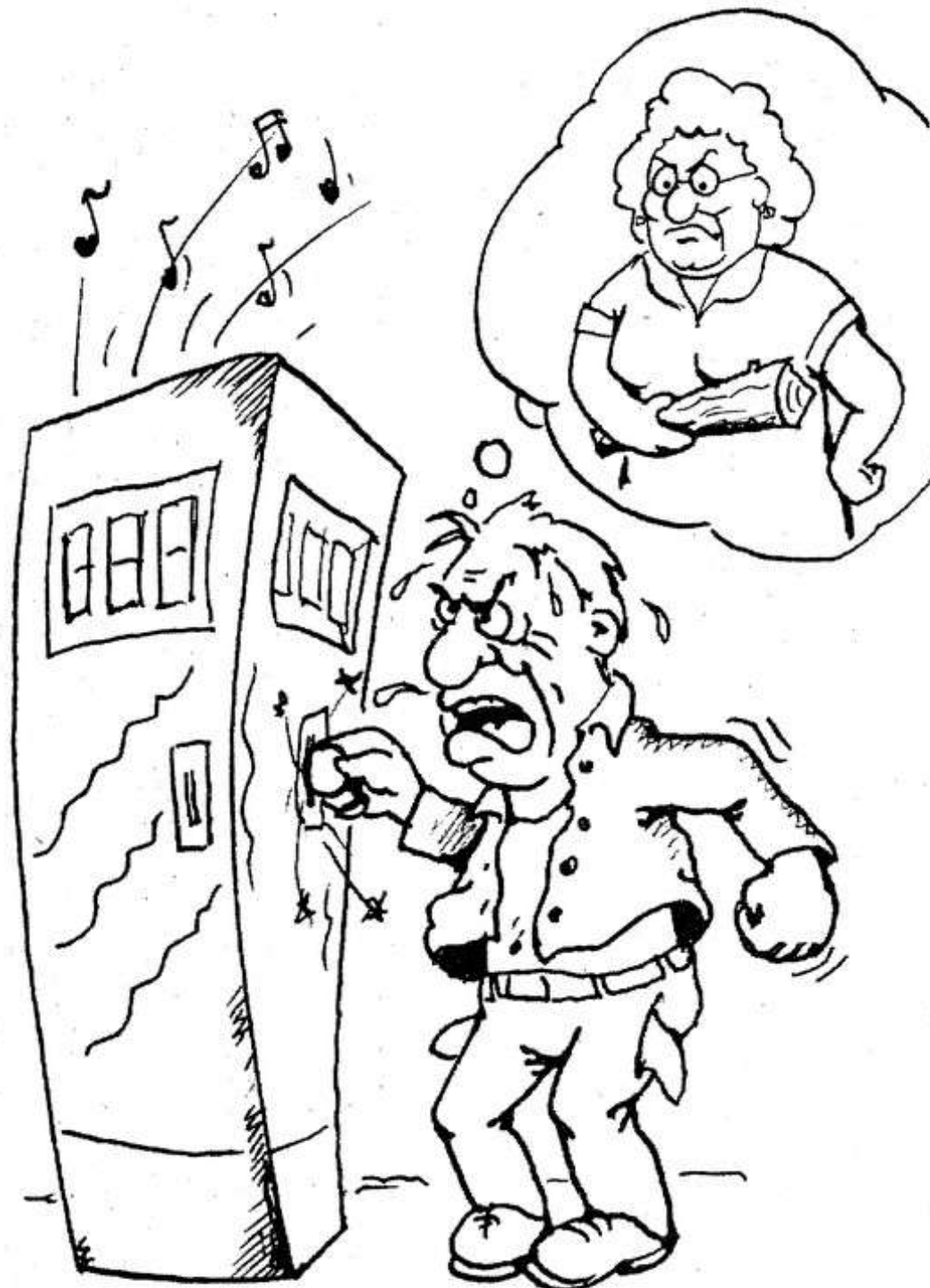
Рисунок А. Семёнова.

И сделать ход решил конем. «На все сыграю, без остатка, Когда-нибудь да повезет!» Но что в мечтах выходит гладко, На деле ж — все наоборот. Когда последних две монеты Он автомату отдавал, Кольнуло слева что-то где-то, Гаврила на землю упал. В углу заплеванного пола И от сердечного укола Лежал Гаврилка недвижим. Склонились граждане над ним. Портвейна дали, откачали, Под руки вывели его И в «скорую» звонить не стали — Гавриле, видят, ничего. Что все трагедии Шекспира Перед Гаврилкой бедой! Он отдал бы теперь полмира, Лишь только б не идти домой... Ведь там жена его встречала С поленом, прямо у двери, И била сильно, и кричала, Но он при чем, черт побери! Раз отвернулось вовсе счастье, Ты лучше больше не играй, Тогда семейное ненастье Не перельется через край! Со временем сошли все шишки И пожелтели синяки, Но наш закаялся Гавришка Играть до гробовой доски... Егор Бурчалкин.