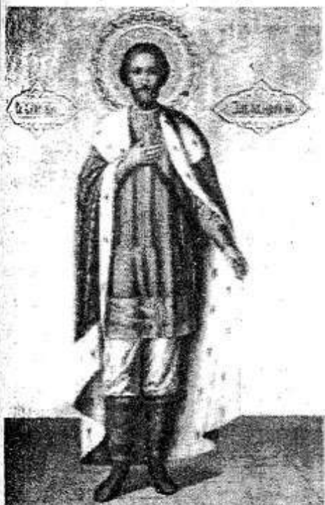
Святый благоверный княже Александре, моли Бога о нас!