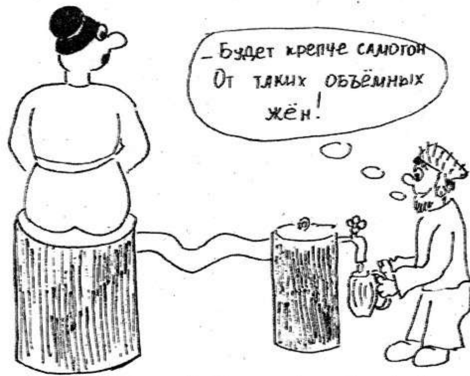
Рисунок Дашы Езоровой (з.Оночка).