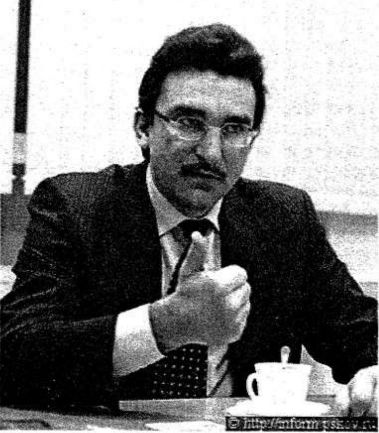
потеряем все возможности для развития сельского хозяйства...

Чем медленнее мы укрепляем свои позиции на рынке продукции АПК, тем больше мы рискуем, что рынок займут производители из других регионов.