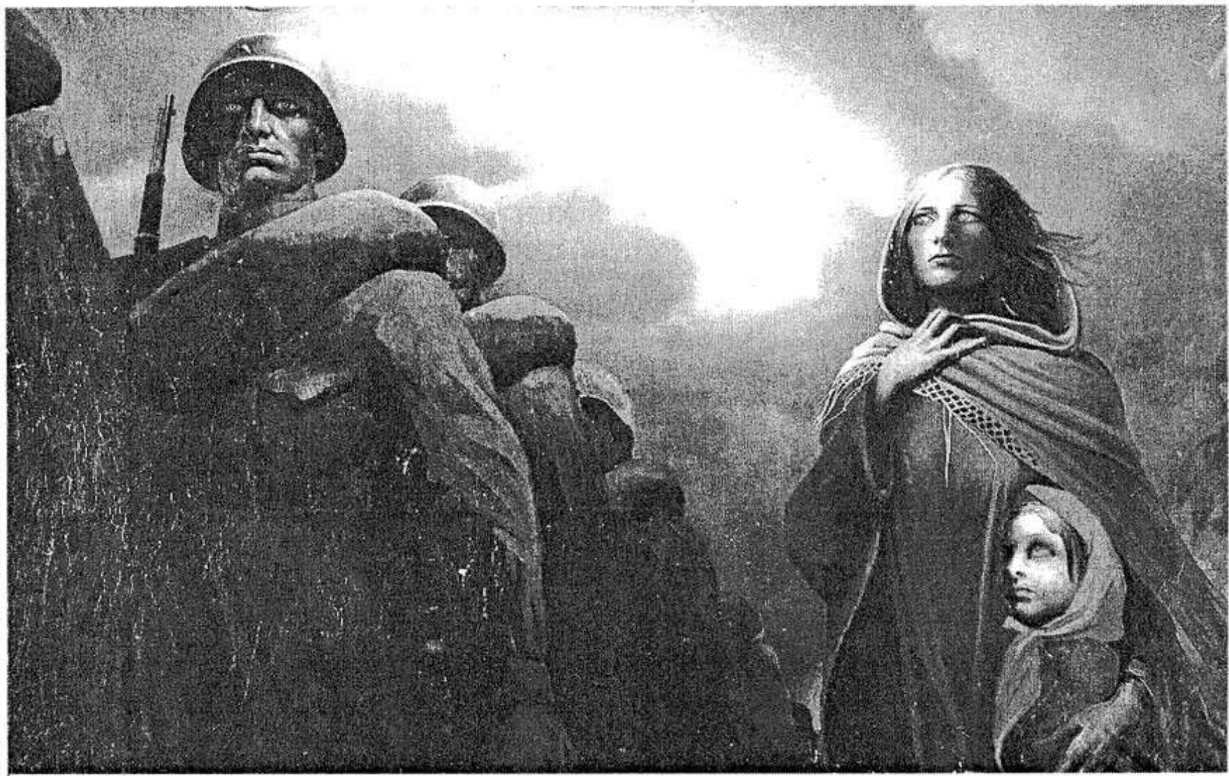
К.А.ВАСИЛЬЕВ. Прощание славянки.