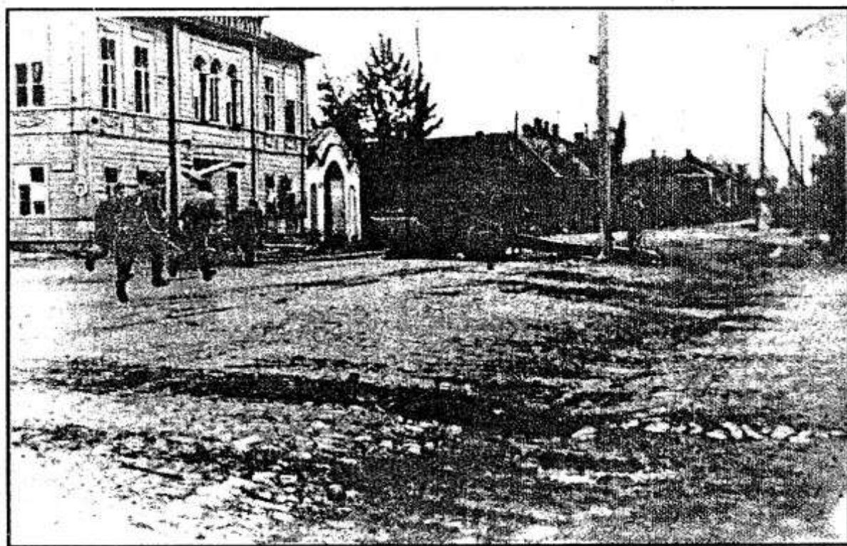
Июль 1944 г. (слева - бывшее общежитие педучилища).

Администрация и Собрание депутатов района.