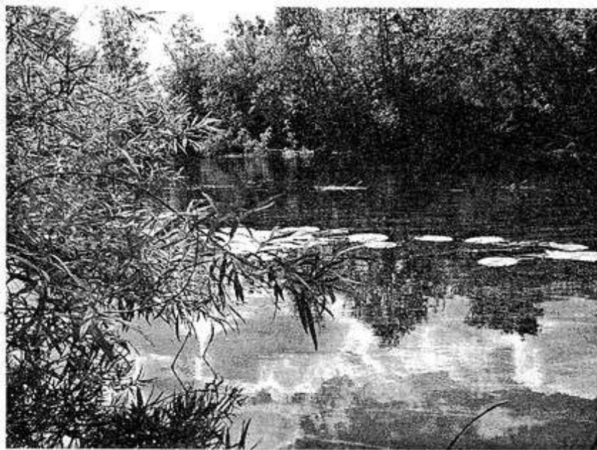
ВОТ И ЛЕТО ПРИШЛО.

Двое непосредственных исполнителей убийства приговорены к 16 годам лагерей.