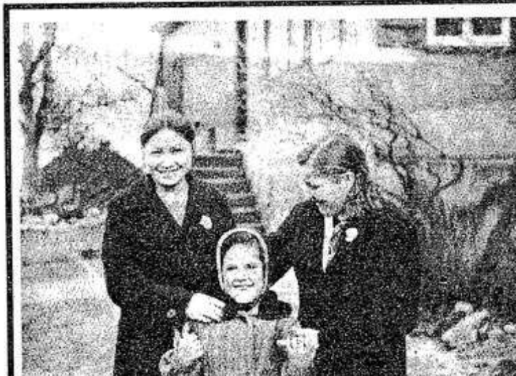
СЧАСТЛИВЫЕ ДНИ В РОЙДЕРНЕ