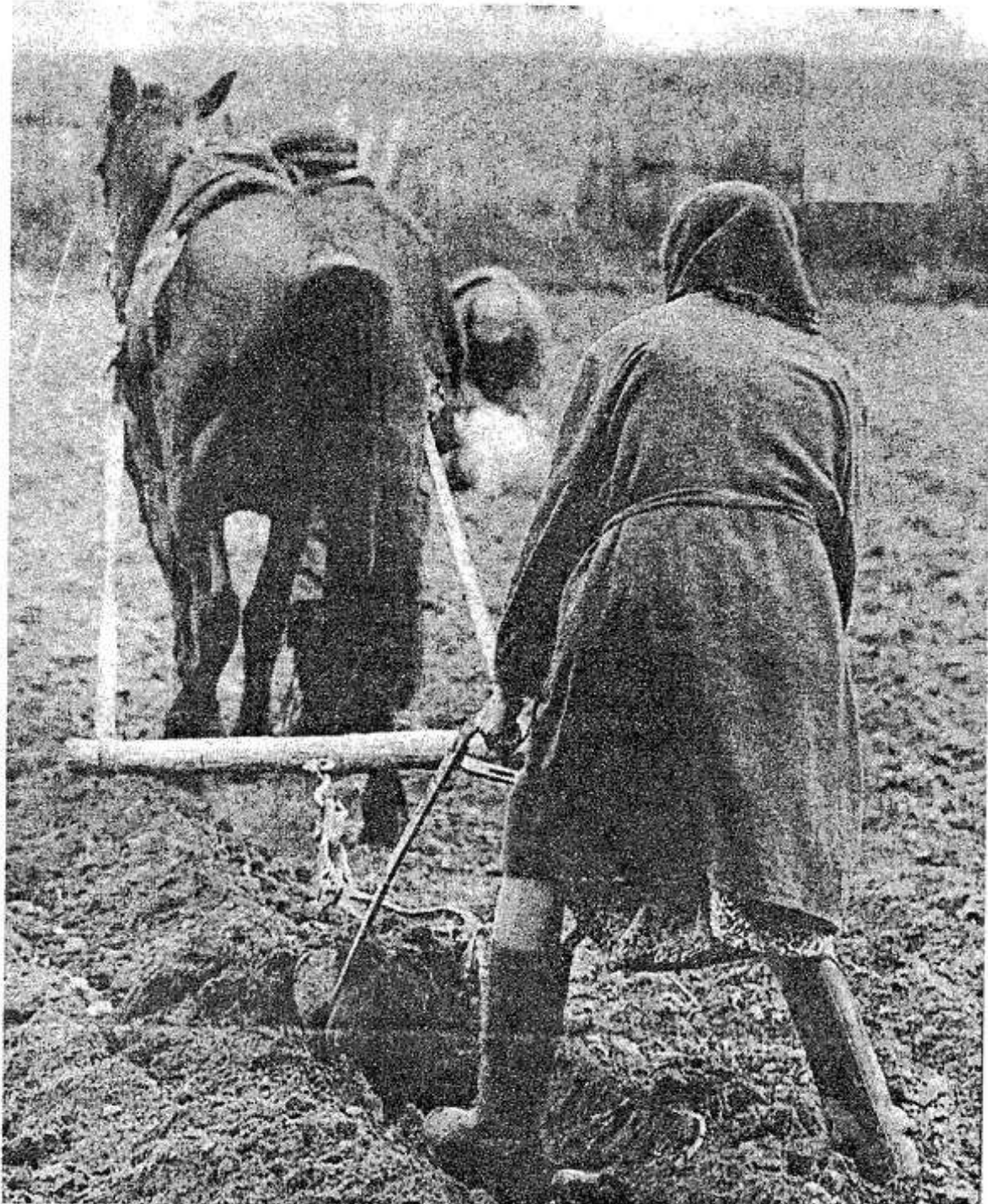
Посевная первого года 21-го века.

Вслед за Белоруссией Брянщина может лишиться своего лесного хозяйства. Причина этому жуки-короеды, совершенно обогатившие в последнее время. Проникают они в знаменитые на весь мир дремучие брянские леса из Белоруссии и поражают огромные участки еловых насаждений. Только в прошлом году очаги распространения жуков равнялись 3 тыс. га. В этом, по мнению лесников, нашествие лесной саранчи будет не меньшим. Как заявляют специалисты, подобное нашествие случается примерно раз в 100 лет.