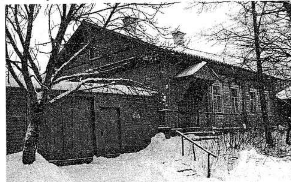
НА СНИМКЕ: дом № 58 по ул. Гагарина.

Одиннадцатый номер журнала "Звезда" желающие могут спрашивать в центральной районной библиотеке.