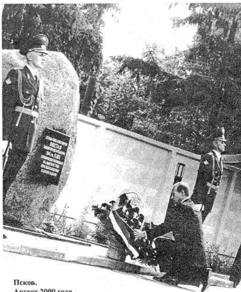
Псков. Август 2000 года.

В Мордовии к борьбе с самогонварением подключат ФСБ. Об этом заявил председатель правительства Мордовии Владимир Волков. По его мнению, этот подпольный бизнес «подрывает основу государства - а это уже сфера ответственности ФСБ». Волков считает, что фактически в каждом жилом доме Саранска есть свои точки перегонки и круглогодичной продажи самогона. Правоохранительным органам республики поставлена задача подвергнуть весь город планомерным антисамогонным зачисткам.