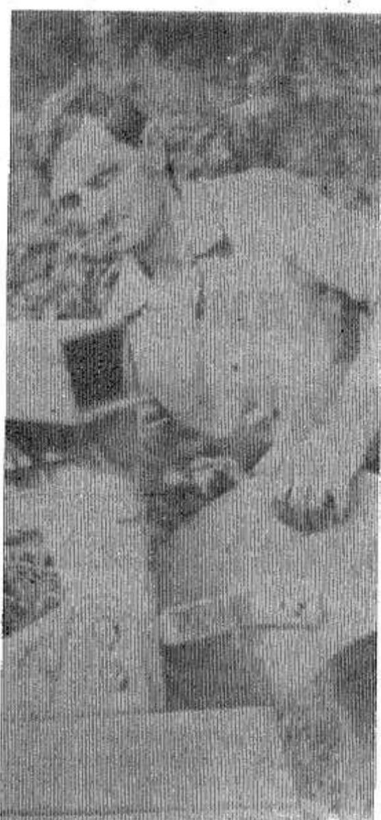
В севообороте акционерного общества «Нива» озимые зерновые культуры занимают значительное место. Ставку

на них сделали не случайно: урожайность у них выше в сравнении с яровыми культурами, и сроки уборки приходятся на более благоприятное по отношению к погодным условиям время, что тоже немаловажно.