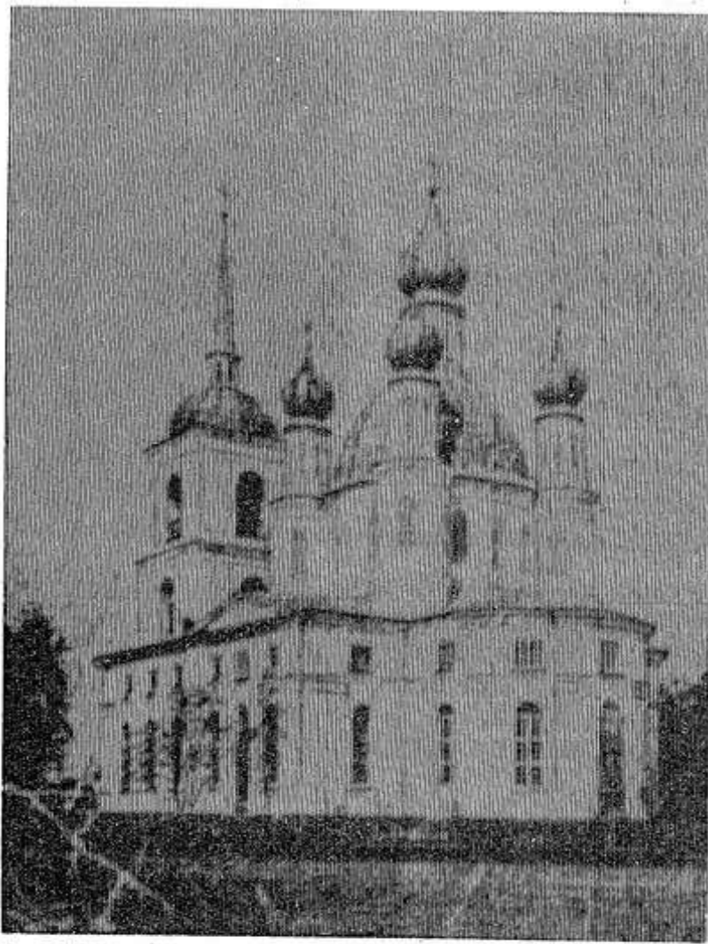
НА СНИМКЕ: так выглядел собор в начале века.