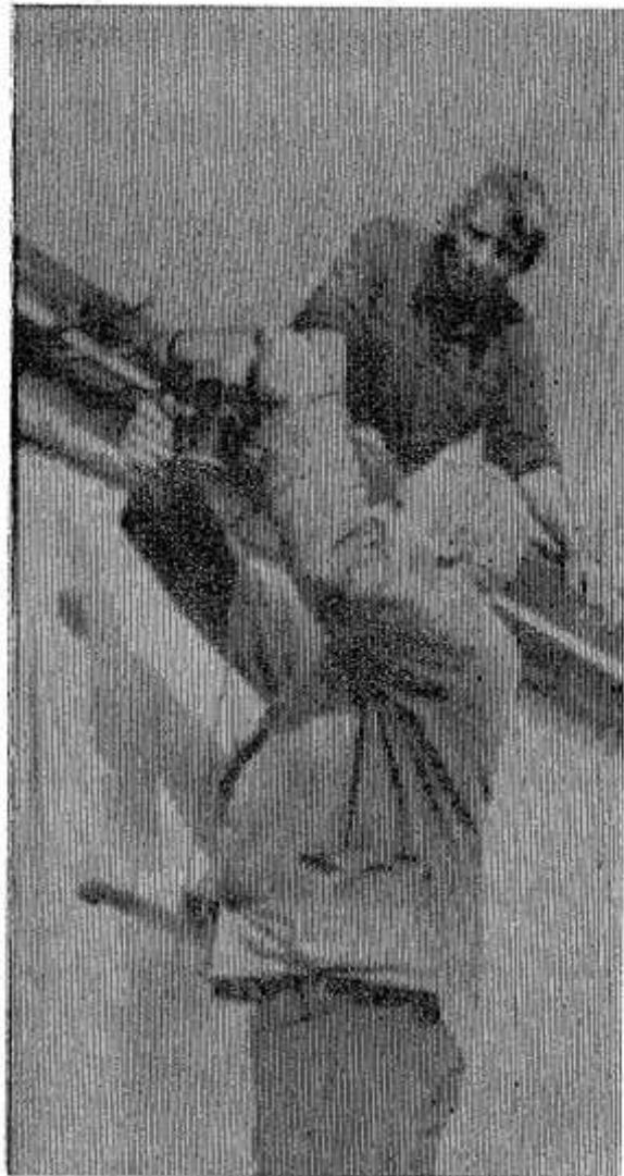
Самые значительные объекты в Опочке, на которых сейчас трудятся строители АО «Опочкаагропромстрой», — здание РОВД и стройка на