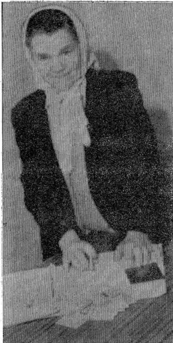
(Псков — 100 тысяч рублей, Новоржев — 76 тысяч рублей и т. д.)

Оказать помощь в ремонте дач, бань, сараев и т. д. государство не в силах. Однако и то, что удалось в материальном плане сделать в наших сложнейших сегодняшних условиях, говорит о том, что власть не бросила людей, попавших в беду, и помогла чем могла. Деньги, поступающие на счет администрации района, незамедлительно, в течение суток, перечисляются или выплачиваются пострадавшим.